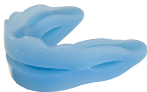
Activateur Buccal +

Les Activateurs Buccaux Tedop permettent une parfaite sollicitation proprioceptive (dents, ligaments, muscles,...), favorisent un travail musculaire équilibré et procurent ainsi au patient, une extrême détente des articulations des mâchoires.